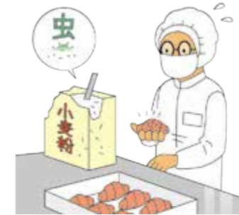
製造した小麦粉に異物が混ざっており、納入先が製造したパンが出荷できなくなったとして、損害賠償請求を受けた。