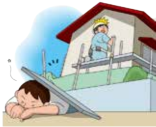
工事中に足場が倒れ、通行人に重い後遺障害をあたえてしまった。