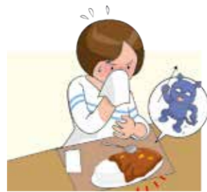
提供した食品が原因でお客様が食中毒をおこしてしまいました。