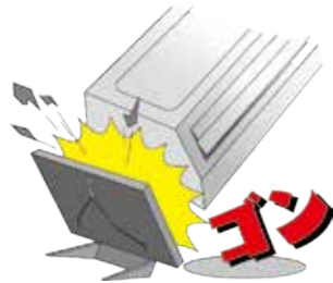
設置したエアコンが取付不備により落下し、下にあったテレビを破損させてしまった。