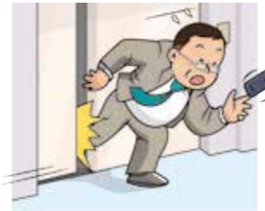
エレベーターの誤作動で、来店されたお客さまが扉にはさまれてケガをした。