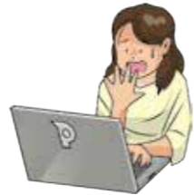
お客様のパソコンを修理し引き渡した後に、パソコン内のデータが壊れていることが判明した。

再作成費用または1,000万円のいずれか低い額を法律上の損害賠償金として補償の対象とします。