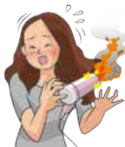
国内向けに製造したドライバーに欠陥があり、旅行者が海外で使用時に発火し火傷を負った。