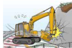
工事現場で、借りていた建設機械をぶつけて壊してしまった。

業務(仕事)の遂行のために他人から借りている財物(不動産を含みます。)または保管・修理等を目的として預かっている財物の損壊等