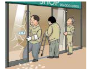
賃借している店舗のドアが泥棒に壊され、法律上の損害賠償責任は発生しなかったが、貸主との契約に基づいてドアの修理費用を負担した。

業務(仕事)の遂行のために、他人から借用する、または施設の運営管理を受託する不動産を損壊等した場合の修理費用