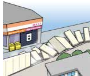
工事終了後に工事した壁が崩れてしまった。周囲に損害はなかったが、近隣店舗の入り口がふさがれたことで壁を修復するまでの1週間は休業となり、収益減少が生じた。

事故により、他人の財物の損壊はなかったものの、他人の財物を使用できなくなったことによる収益減少などの損害賠償責任を補償します。