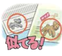
新聞広告に用いた絵が著作権を侵害しているとして、損害賠償請求を受けた(宣伝侵害)。