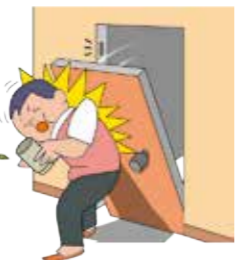
ドアの取付けが不完全でドアが外れ、住人にケガをさせてしまった。