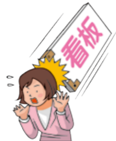
店舗の看板が落ちて、通行人にケガをさせてしまった。