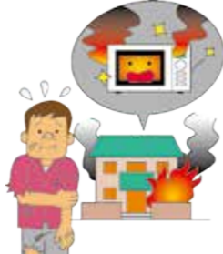
製造した電子レンジから出火して、火災が発生。家が焼失してしまい、住人がケガをした。