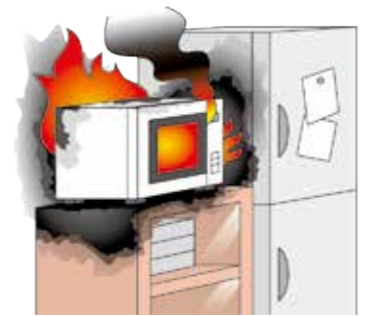
製造した電子レンジから出火して火災が発生し、周りの家財が焼けてしまった。出火した電子レンジの回収、交換費用が発生した。

基本補償またはそれにセットされる特約 (注3) で補償される事故が生じた場合に、事故の原因となったその生産物や仕事の目的物自体の損壊およびその使用不能についての損害賠償責任や回収、検査、修理、交換、廃棄するための費用を補償します。