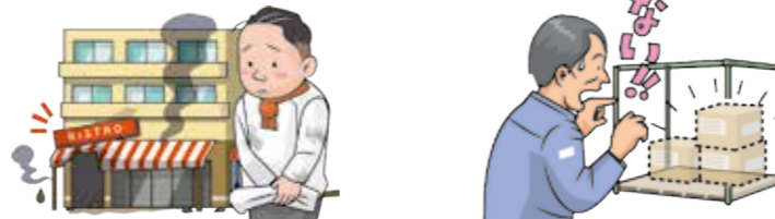
賃借している店舗を、調理中の火事で焼失させてしまった。

⚠自動車、原動機付自転車(他人から借用・リースしたもので、作業場内品は補償されません。また、運送事業者である被保険者が業務の遂行に必要として一時的に管理している財物は保管(借用・受託)財物にあたらないため、この支払限度額は適用されません。