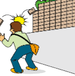
施工完了後に外壁のタイルがはがれ、通行人にケガをさせてしまった。