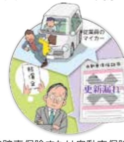
従業員がマイカーで取引先に向かう途中、通行人にケガをさせてしまったが、自動車保険の更新漏れが発覚。マイカーの業務使用を認めていた事業者が損害賠償請求を受けた。

⚠自賠責保険または自動車保険が締結されている場合は、損害の額が自賠責保険または自動車保険により支払われるまたは支払われた保険金の合計額を超過する額に対してのみ、保険金をお支払いします。