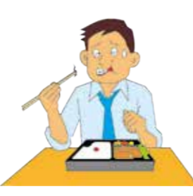
販売したお弁当のなかに異物が混入しており、お客様が口の中を切ってしまいました。