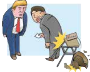
海外出張中に取引先の備品を壊してしまった。