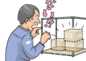
倉庫で預かっている荷物が盗まれた。