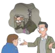
エレベーターの管理不備が原因でお客さまが閉じ込められ、精神的ショックを受けたとして、損害賠償請求を受けた(人格権侵害)。