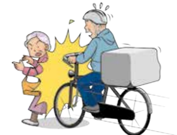
自転車で荷物を配達中に通行人にぶつかり、大ケガをさせてしまった。