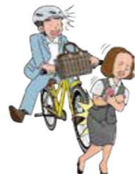
従業員が取引先から自転車で帰社中、昼食を買うためコンビニに行こうとしたところ、歩行者にぶつかり大ケガをさせてしまった。