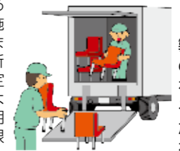
製造・出荷したイスの脚が折れてケガをするおそれがあることが判明したため、製品の回収を行った。

！お支払いの対象となるのは、リコールの実施および事故の発生またはそのおそれが新聞、雑誌、行政庁所定の様式および方法による届出など客観的に明らかとなった場合に限りです。