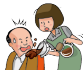
飲み物を運んでいる際に、誤ってお客さまの衣服に飲み物をこぼし汚してしまった。