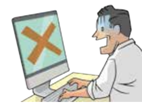
取引先の事務所でパソコンの出張修理作業を行っている際に、誤ってデータを消失させてしまった。

施設の所有・使用・管理または業務(仕事)の遂行による他人のデータまたはプログラムの消失・破損