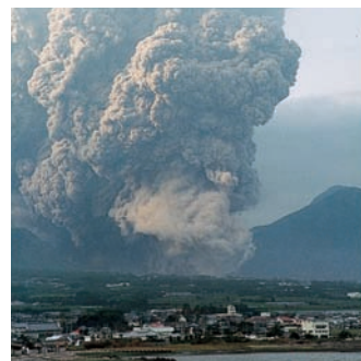
噴火の災害 (有珠山噴火2000年)