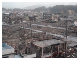
津波の災害 (東日本大震災2011年)