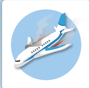
飛行機が墜落して死亡した