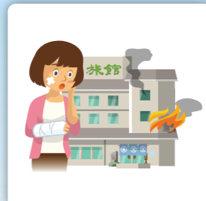
宿泊中火事にあいやケドをした