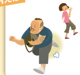
旅行バッグを盗まれてしまったことによる損害