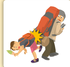
他人にケガをさせてしまった場合の損害賠償金