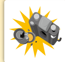
カメラを落として壊してしまったことによる損害