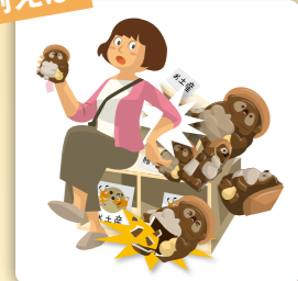
買い物中に商品を誤って壊してしまった場合の損害賠償金