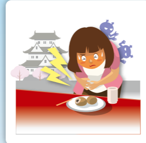
食中毒になり入院した