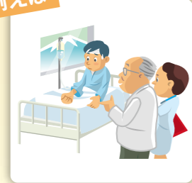
ケガで長期入院(14日以上)することになり、看護のため現地の病院まで来た親族が負担した交通費・宿泊費