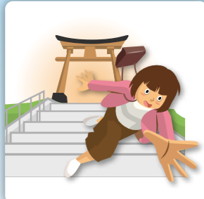
観光中に転倒してケガをした