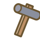
修理付帯費用保険金