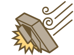
風災・雹(ひょう)災・雪災