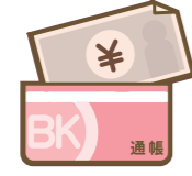
通貨・預貯金証券の盗難