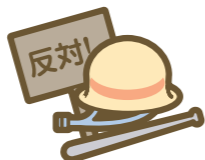
騒擾(じょう)・集団行動・労働争議に伴う暴力行為・破壊行為