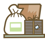
残存物取片づけ費用保険金