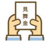
失火見舞費用保険金